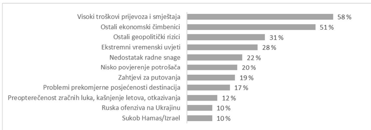
Slika 1. Glavni izazovi turizma u 2025. godini